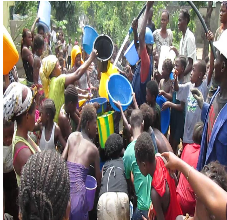
PEMU- Kinshasa : Une borne fontaine construite et équipée à N'djili