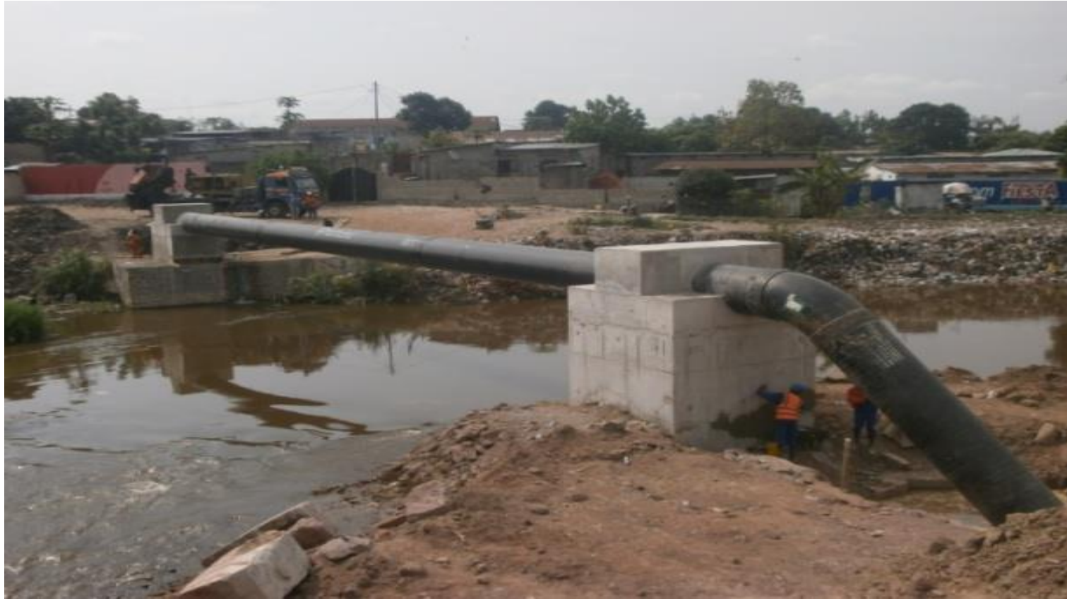
PEMU-Kinshasa: Traversée de la conduite d'adduction d'eau de DN 1.000 sur la rivière N'djili au niveau du captage d'eau brute de N'djili